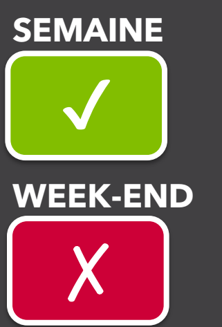
Schéma de prise en charge